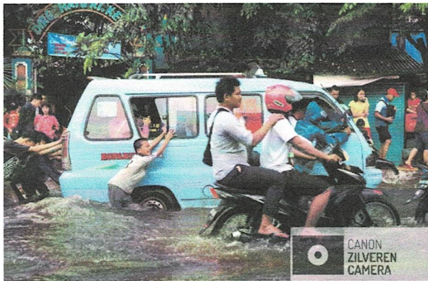
Sinking Cities Jakarta, Cynthia Boll