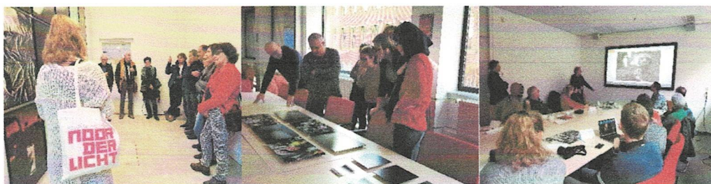
Fotosalons Visual Storytelling, Noorderlicht Groningen-De Stad Verbeeldt