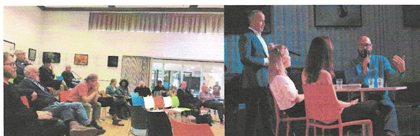
Kick-off bijeenkomst, foto Gerlinde / Stadsgesprek, foto Gerlinde Schrijver